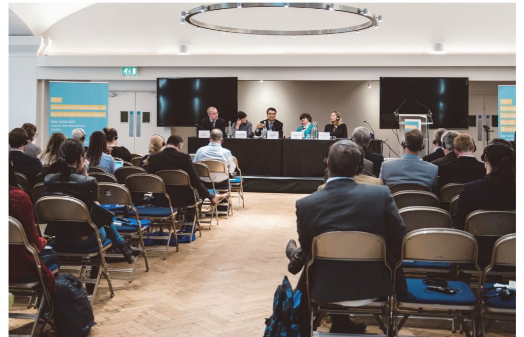
▲ 2세션 토론