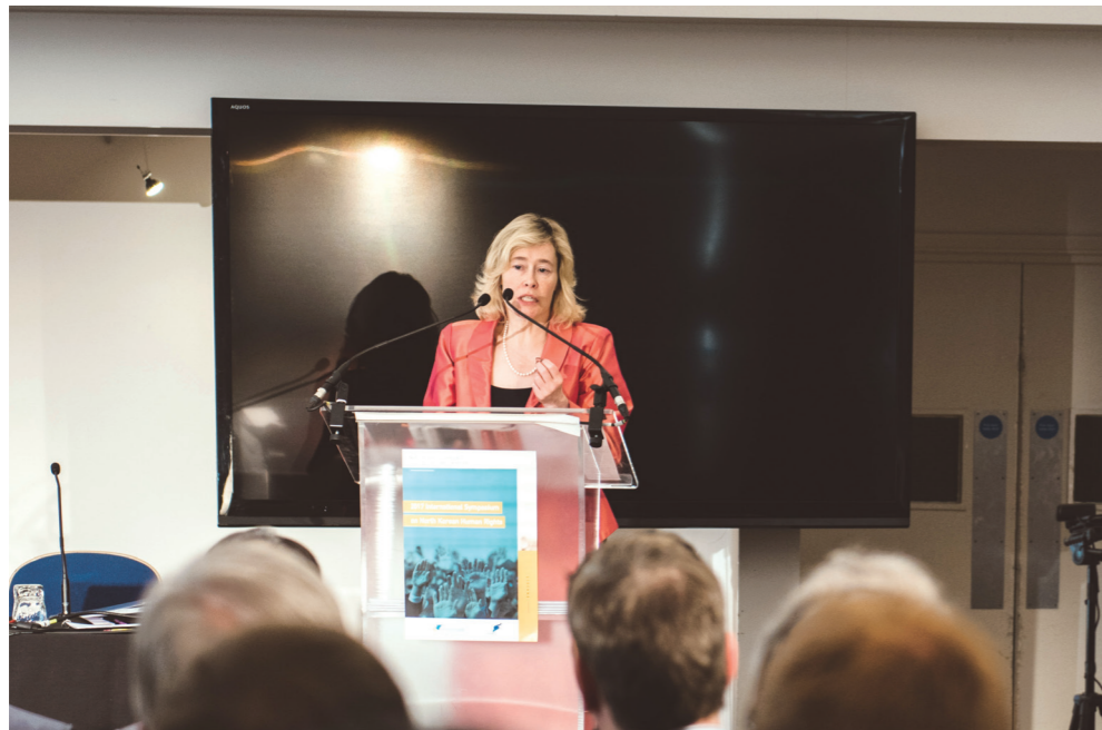
▲ 줄리 스미스 상원의원 기조연설