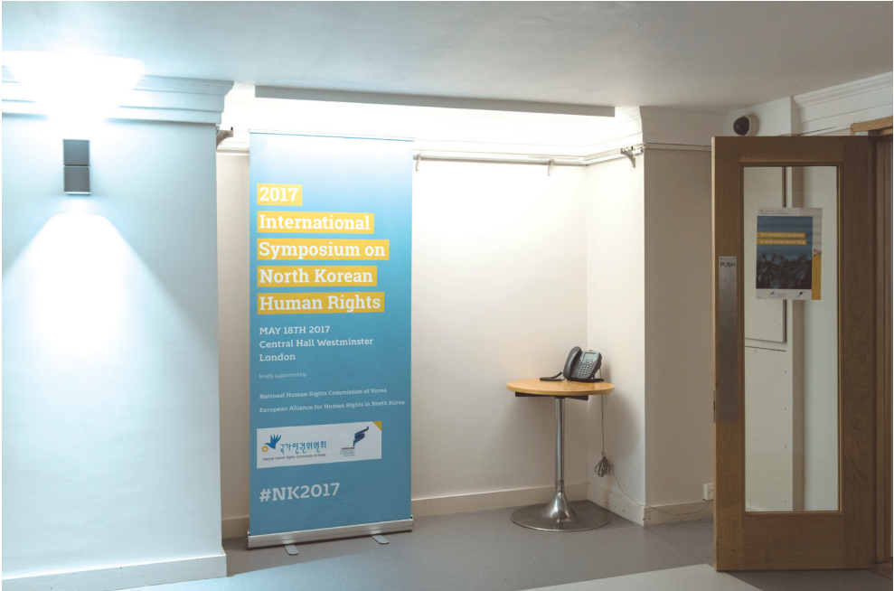
▲ 행사장 입구