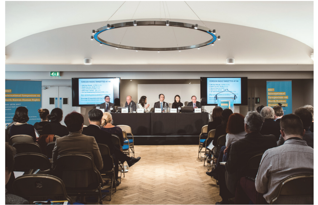
▲ 1세션 토론