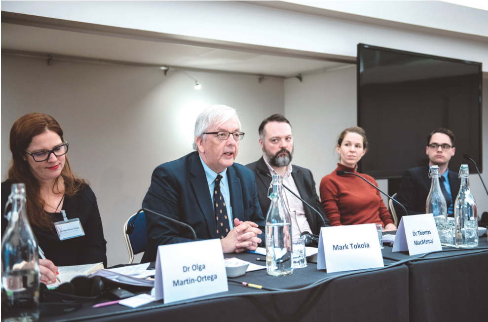
▲ 3세션 토론